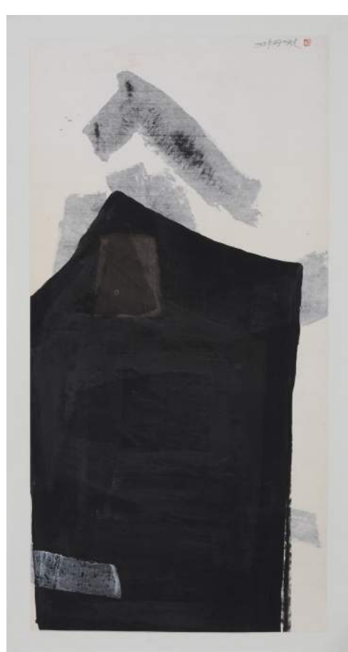
Stèle Technique mixte sur papier, 2013, 180 x 160 cm