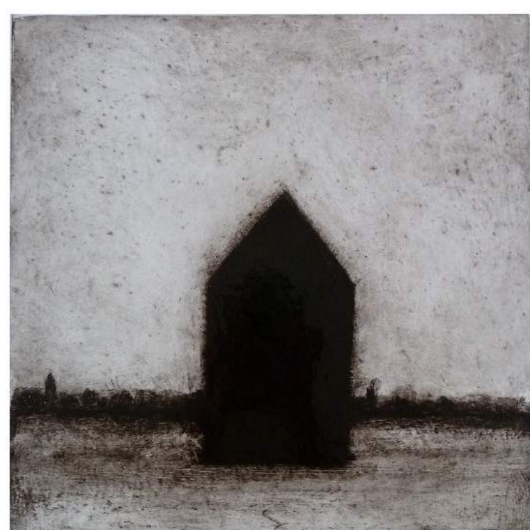
Maison Laque sur toile, 2012, 40 x 40 cm

Loïc Le Groumellec s'est rendu célèbre par ses toiles minimalistes qui déclinent un langage propre, proche de l'obsession : ombres de mégalithes et profils de maisons. Depuis trente ans, ces motifs se répètent dans une approche presque sérielle et dans une recherche de perfection absolue. De leur surface étrangement lumineuse, réalisée par effacement progressif de la laque noire, émerge un univers à la fois sobre et mystique.