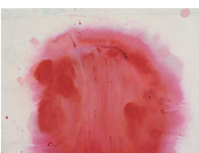
Rouge de cinabre Huile sur toile, 2013, 47 x 64 cm

Originaire de la côte ouest de la Bretagne, ce peintre des confins, peintre de l'humide et du sauvage, est un parcoureur de solitudes. Ses oeuvres, puissantes et généreuses, ne reflètent pas, ne figurent pas; elles décryptent, pénètrent la trame du paysage dans sa substance, ses racines, ses tremblements géologiques, son temps séculaire. Matthieu Dorval initie une écriture singulière en lien direct avec la nature. L'instantanéité de son geste, la force de sa palette, l'harmonie de ses compositions expriment l'immuable force poétique des éléments.