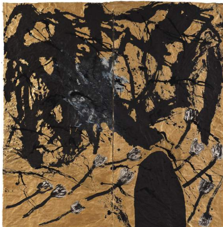
Sans titre Technique mixte sur papier, 2012, 180 x 160 cm