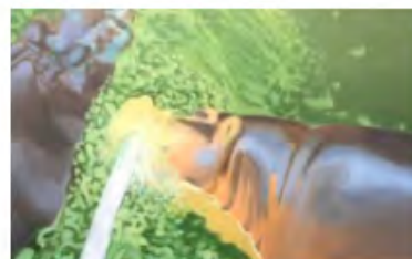
Coups de cœur