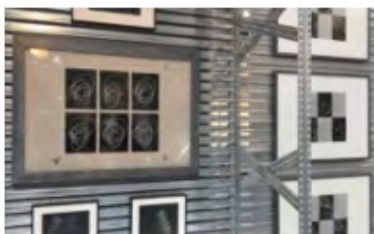
Une scénographie signée Dominique Perrault