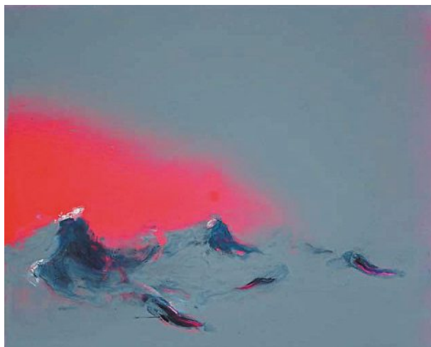
▲ Vent de mousson (2017) . Matthieu Dorval peut passer un temps fou sur les métamorphoses des éléments, le rythme des vagues, « le passage du solide au liquide ».