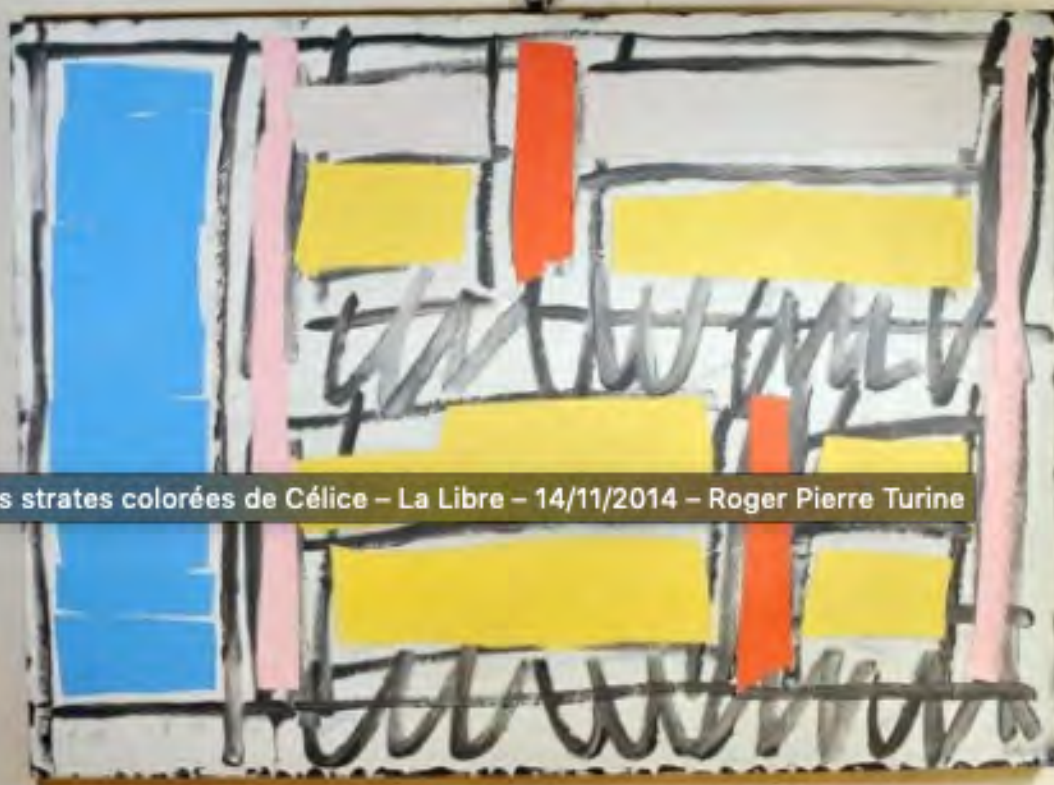
Les strates colorées de Célice – La Libre – 14/11/2014 – Roger Pierre Turine