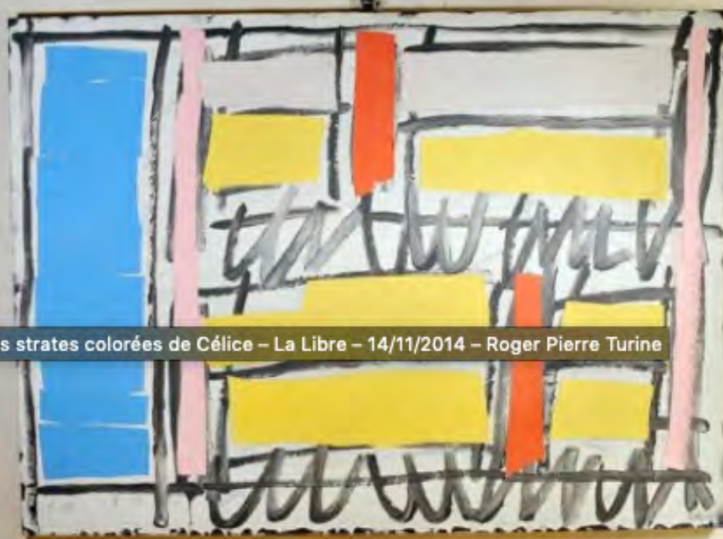
Les strates colorées de Célice – La Libre – 14/11/2014 – Roger Pierre Turine

COURTESY SCHILLERART GALLERY / BRUXELLES