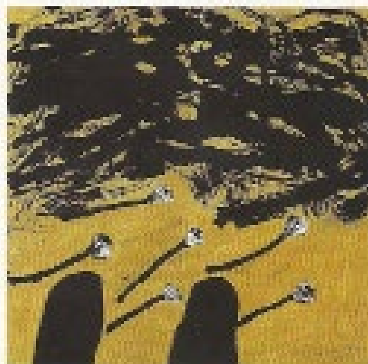
Wei Ligang, Ode to Segalen , 2013, encre et acrylique sur papier de riz, 140 x 140 cm (©WEI LIGANG).

« EXOTE. ESTHÉTIQUES DU DIVERS », L'école des Filles, 02 98 99 75 41, du 29 mai au 14 septembre, + d'infos: http://bit.ly/7281exote