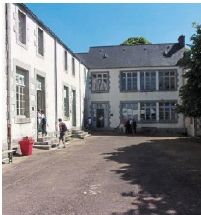
L'École des Filles accueille le 10 mai sa nouvelle saison pour les 6 es Journées Segalen.