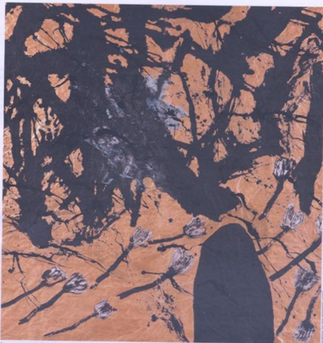
Les paysages de Bretagne ont inspiré au maître calligraphe Wei Ligang cette page intitulée « Ode to Segalen », que dévoile Françoise Livinec.