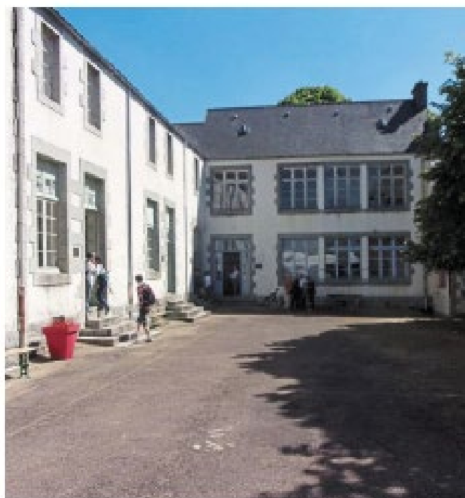
L'École des Filles ouverte le 10 mai sa nouvelle saison pour les 6 es Journées Segalen.