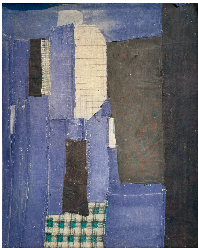
Ge Ba Sans titre , circa 1950, tissus et colle de riz, 54 x 47 cm