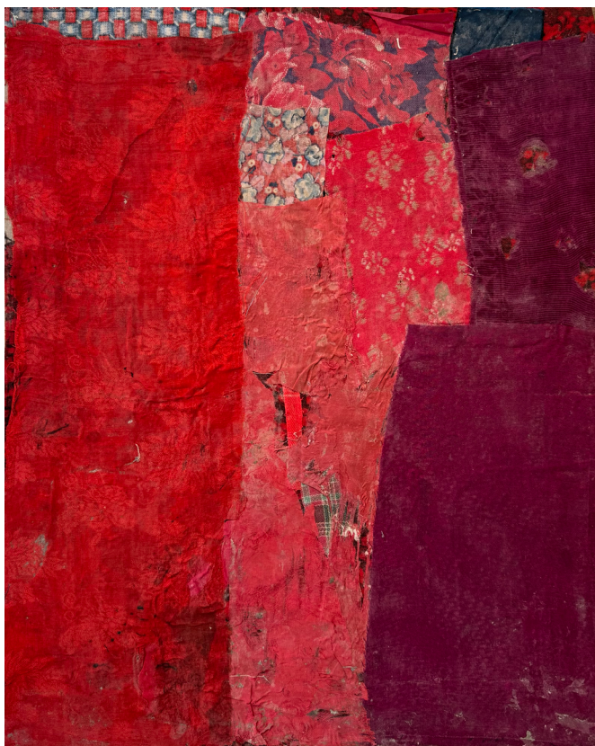
Ge Ba Sans titre , circa 1950, tissus et colle de riz, 54 x 47 cm