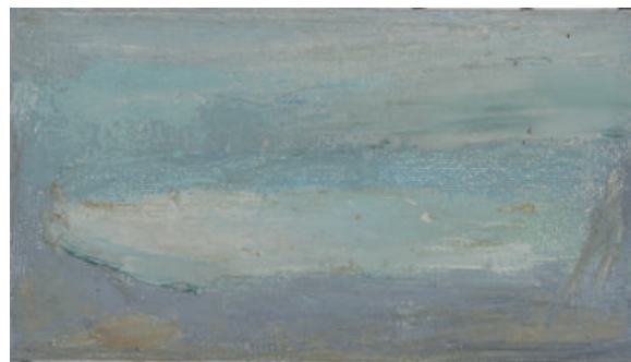
Grosses vagues , huile sur toile, 14 x 24 cm, 1960. Ciel , huile sur toile, 73 x 100 cm, 1962. La flaque d'eau , huile sur toile, 12 x 22 cm, 1980.