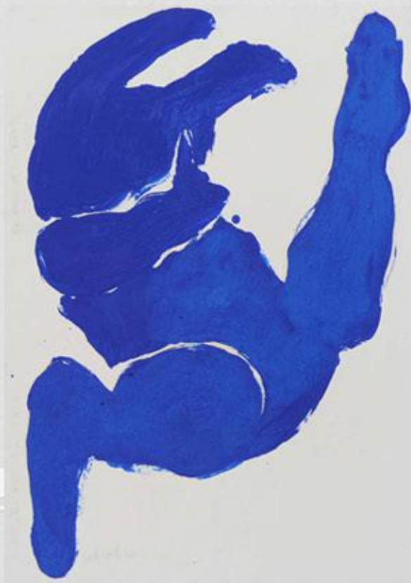
Lapin, 76x56 cm, gouache sur papier. Œuvre présentée à la Galerie Françoise Livinec.