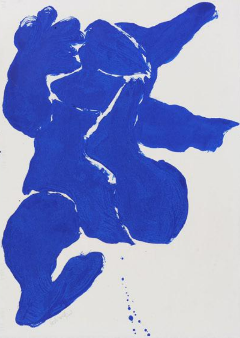
Lapin, 76x56 cm, gouache sur papier. Œuvre présentée à la Galerie Françoise Livinec.