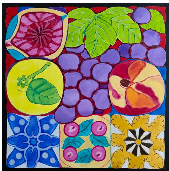
Emna Daoud, Sous le signe du jasmin 2025, huile sur toile, 30 x 30 cm

Du 12 décembre au 31 janvier 2026, les peintures à l'huile d' Emna Daoud sont montrées à la Galerie Française Livinec à l'occasion de sa toute première exposition personnelle en France. L'Art du motif propose une relecture unique de la nature morte, adaptée aux sensibilités méditerranéennes et contemporaines.