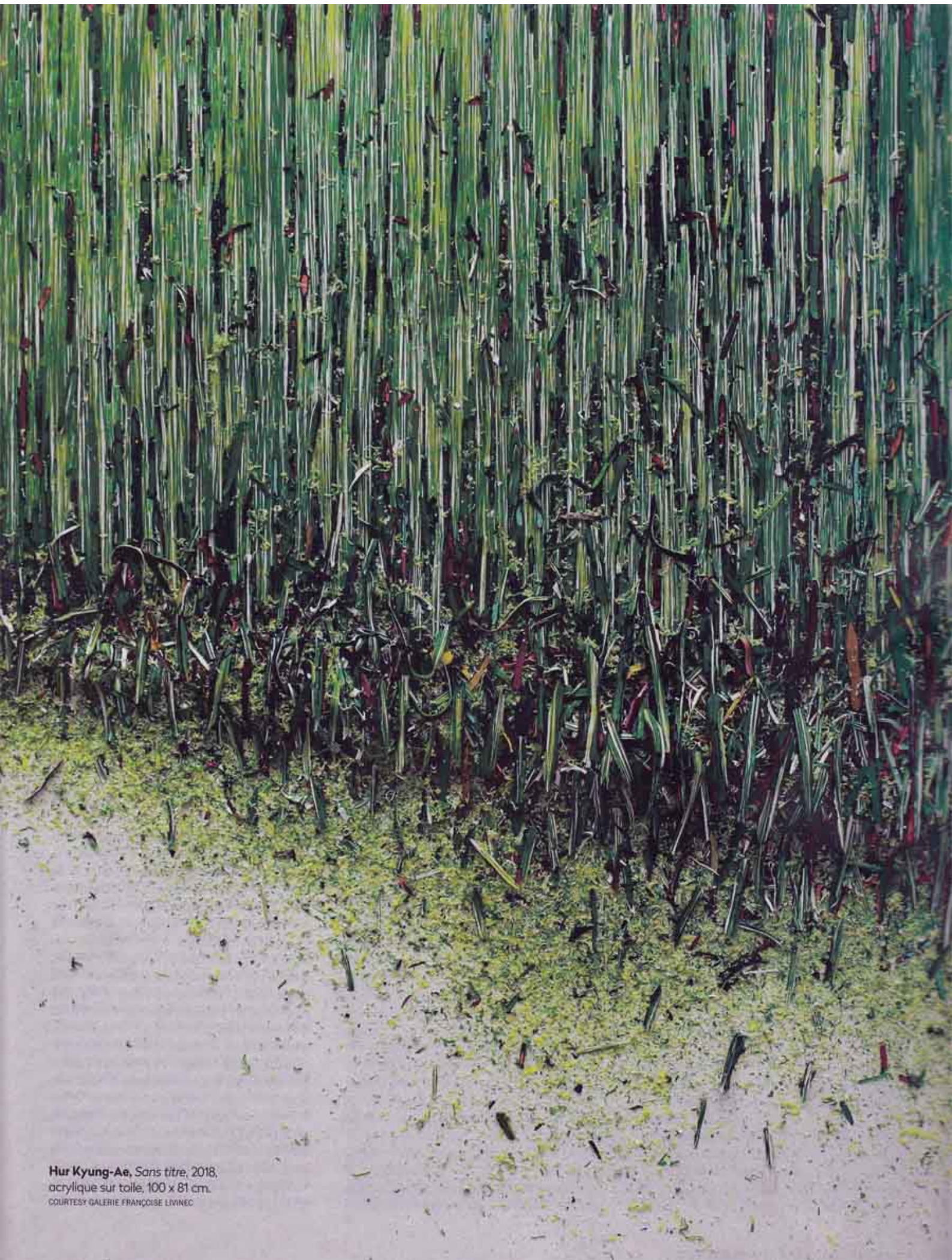
Hur Kyung-Ae , Sans titre , 2018, acrylique sur toile, 100 x 81 cm.